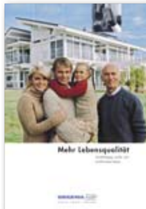
Mehr Lebensqualität Unabhängig, sicher und komfortabel leben