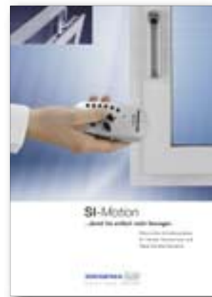
Si-Motion Damit Sie einfach mehr bewegen