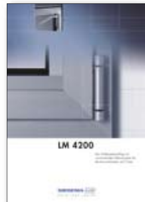
LM 4200 Der Drehkippschlag mit vormontiertem Klemmsystem für Aluminium-Fenster und -Türen