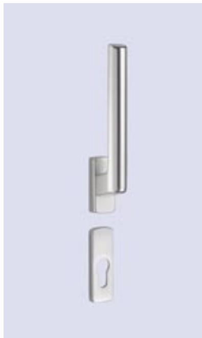
Getriebe abschließbar mit Profilzylinder