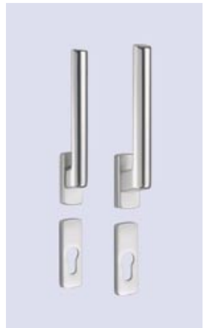
Hebel innen und außen abschließbar