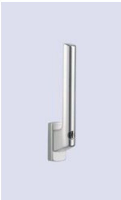
Hebel abschließbar mit Drehzylinder